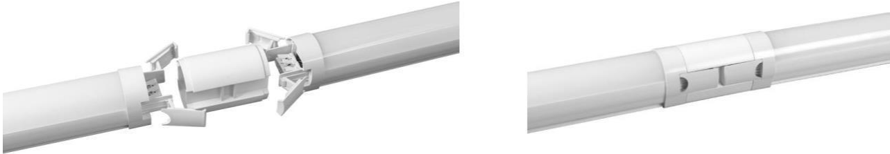
Unión a través de modulo LITSTC