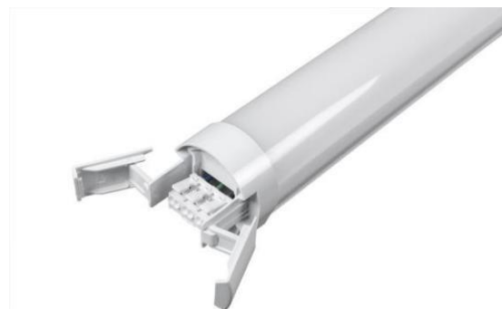
Clemas "rápidas" con tapas de cierre automático